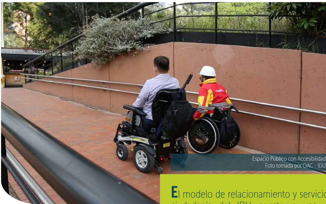
Espacio Público con Accesibilidad