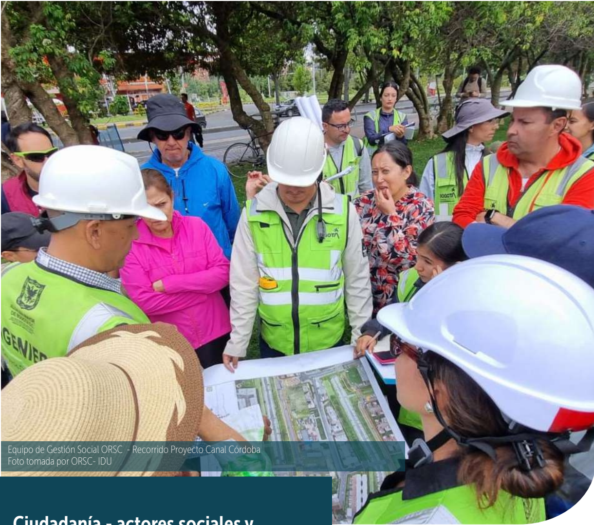
Equipo de Gestión Social ORSC - Recorrido Proyecto Canal Córdoba