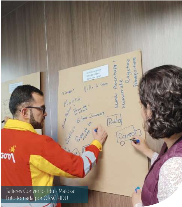
Talleres Convenio Idu - Maloka