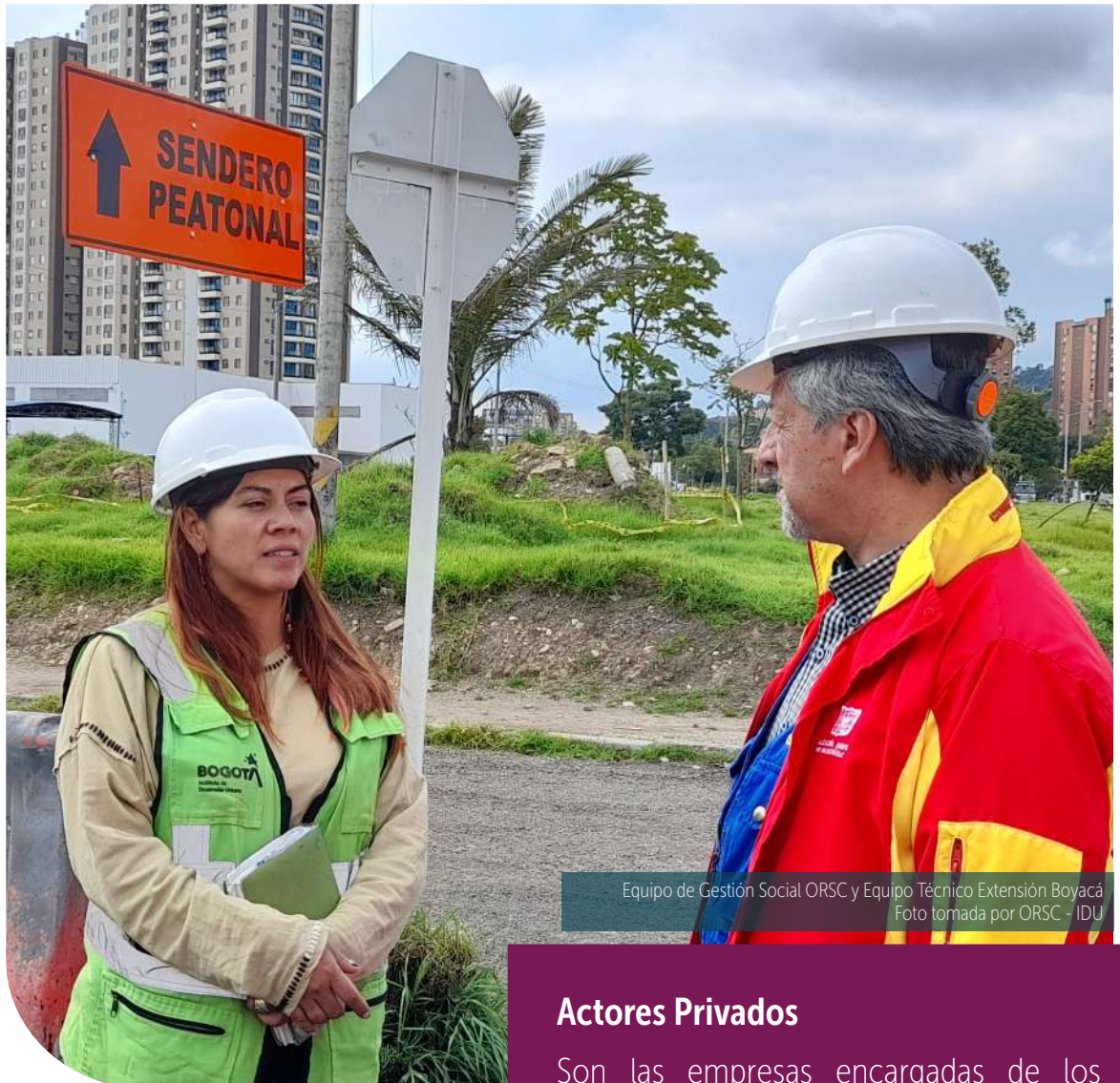
Equipo de Gestión Social ORSC y Equipo Técnico Extensión Boyacá

El IDU ha identificado a sus grupos de interés conforme a la responsabilidad que tiene la organización con ellos, el nivel de influencia y la dependencia para la gestión de la entidad.