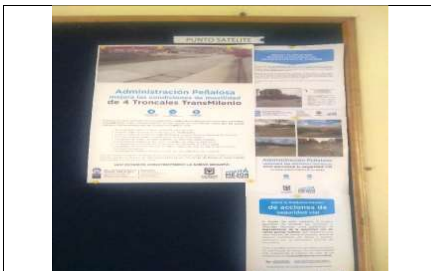
Foto No. 12. Instalación puntos satélites, localidad de Fontibón.