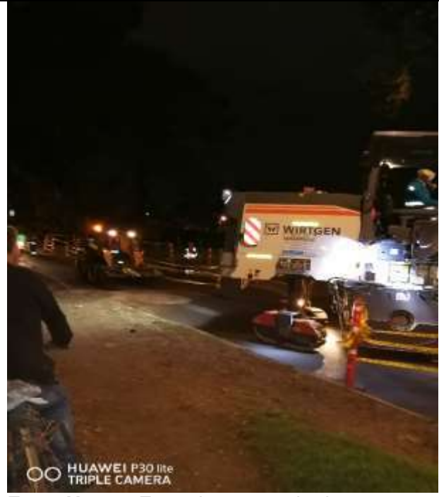
Foto No. 9 Fresadora, escoltada por otra máquina que no cumple con las especificaciones necesarias para prestar este servicio.

Se verificaron los campamentos de obra en cada uno de los puntos, donde se observó la implementación de los puntos de hidratación, suministro e instalación de los kit de emergencia, extintores certificados, camillas, baños portátiles y adecuaciones sanitarias para el personal de obra, como se puede observar en el registro fotográfico N.º 10 y 11.