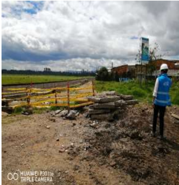
Foto No. 1 Material RCD acopiado fuera del área delimitada.