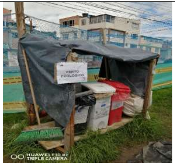
Foto No. 4 Ubicación punto ecológicos.