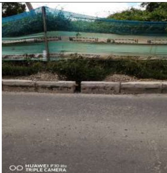
Foto N.º 21. Elementos sin confinamiento.