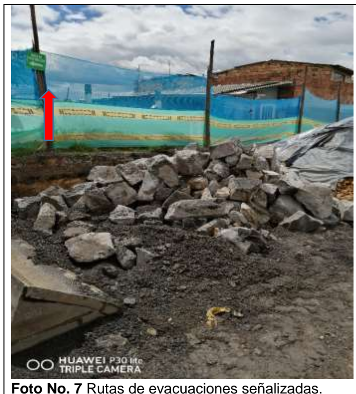
Foto No. 7 Rutas de evacuaciones señalizadas.

fotográfico N.º 7, encontrándose que el contratista, en términos generales, ha dado cumplimiento al SGSST en este aspecto: