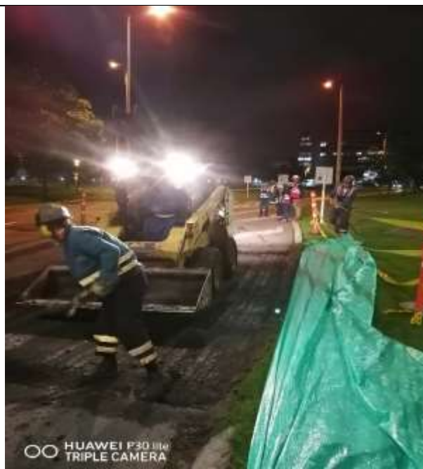
Foto N.º 22. Frente de obra nocturno.