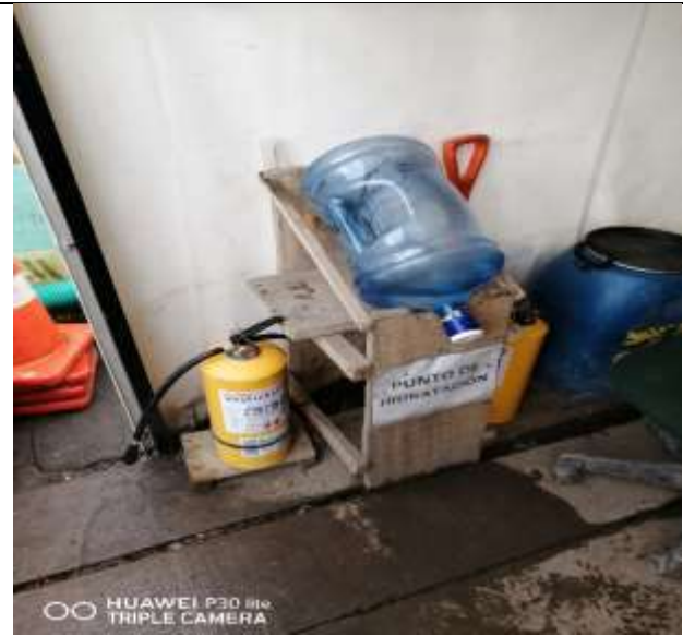
Foto No. 11 Ubicación de extintores y puntos de hidratación.

3. Aspecto social: en visita desarrollada el 07 de junio de 2019 se indagó con la residente social de obra e interventoría, sobre soportes que evidenciaran el cumplimiento de las obligaciones específicas del contratista en este componente y en el Apéndice E-2 Obligaciones de Gestión Social, obteniéndose los siguientes resultados, frente a algunas actividades, verificadas para el contrato en general: