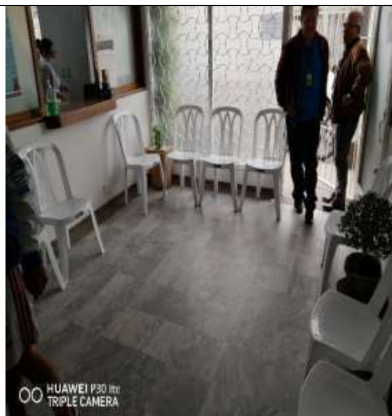
Foto N.º 14. Recepción para atención al ciudadano, sin planos a la vista.