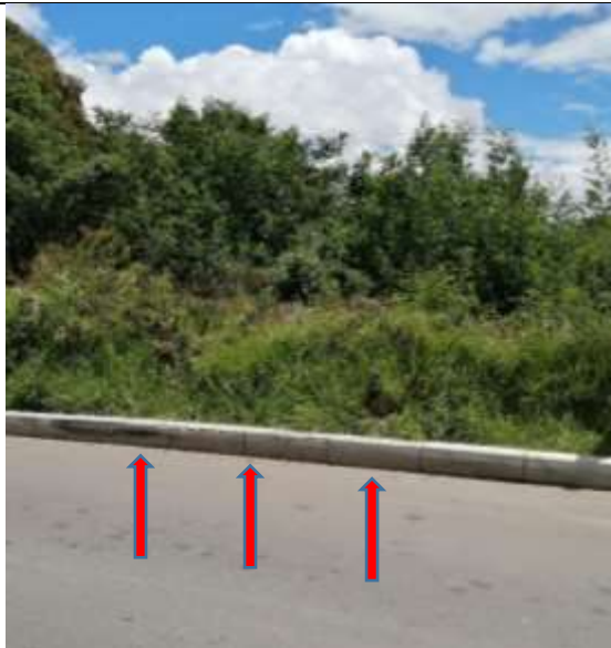
Foto N.º 20. Elementos desportillados.