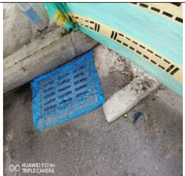
Foto No. 6 Protección de sumideros.

Se verificó también, que se dio cumplimiento al cronograma de capacitaciones establecidas en el MAO, durante la ejecución de las obras, para los periodos de abril y mayo de. Se tomaron 10 muestras de cada periodo, de acuerdo con la relación de la siguiente tabla: