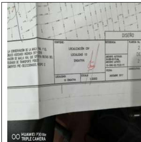
Foto N.º 13. Incumplimiento de la escala requerida en el Apéndice E-2, escala observada 1:5000.