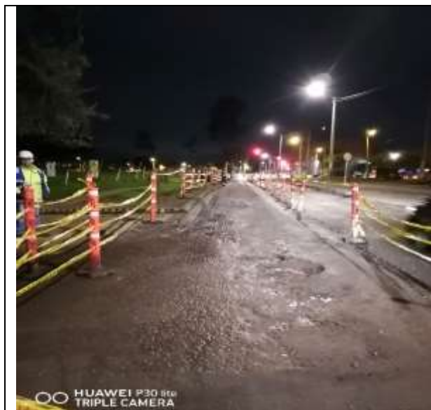
Foto No. 5 Adecuado manejo de cerramiento.