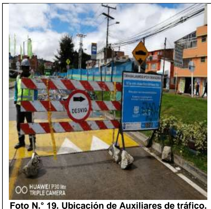
Foto N.º 19. Ubicación de Auxiliares de tráfico.

Se observó en el frente de obra ubicado en la Avda Calle 153, entre Carrera 104 y 109, que los auxiliares de tráfico se encontraban en sus puntos de ubicación, con los elementos de señalización y los correspondientes Elementos de Protección Personal-EPP, cumpliendo con lo señalado en los planos del PMT, como se puede observar en el registro fotográfico No. 19.