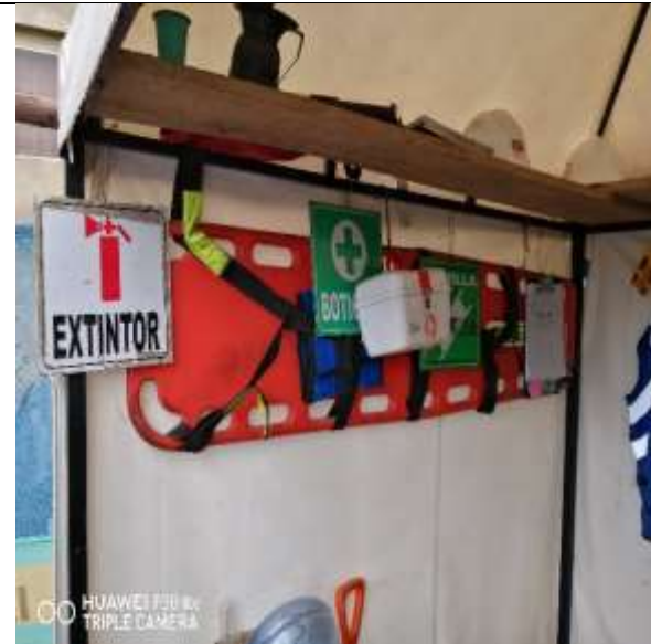
Foto No. 10 Implementación de camillas, botiquín y kit de primeros auxilios.