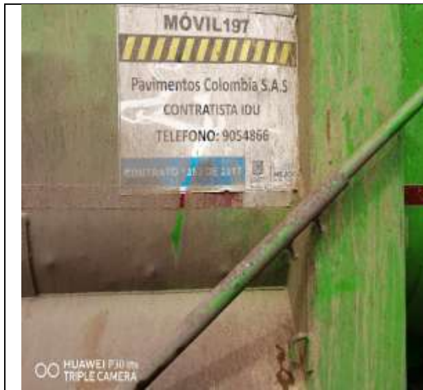
Foto No. 3 Identificación de volqueta.