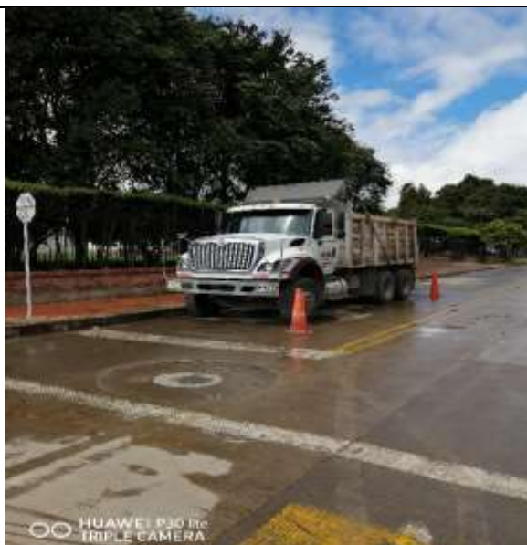
Foto N.º 17. Móvil No. 41, estacionada fuera de la zona de parqueo establecida.