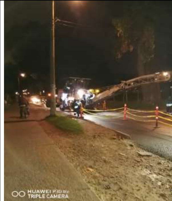
Foto No. 8 Fresadora llegando al frente de obra.

y movimiento de maquinaria, equipos y vehículos especiales, como: cama-baja, cama-alta, vehículos escolta, etc., que garantice las condiciones de seguridad necesarias para el movimiento de equipos pesados (...) ”.