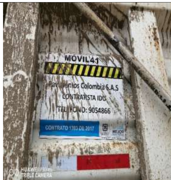
Foto N.º 18. Número de identificación interna No. 41.

Se observó en el frente de obra ubicado en la Avda Calle 153, entre Carrera 104 y 109, que los auxiliares de tráfico se encontraban en sus puntos de ubicación, con los elementos de señalización y los correspondientes Elementos de Protección Personal-EPP, cumpliendo con lo señalado en los planos del PMT, como se puede observar en el registro fotográfico No. 19.