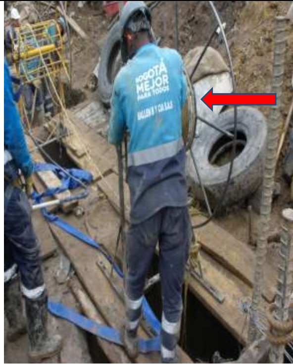
Foto No. 6. Manipulación de la polea sin ningún arnés de seguridad y punto de amarre.

La profesional de apoyo a la supervisión del componente SST, aportó al equipo de la OCI, documento del 22 de marzo de 2019, en donde aparecen relacionados elementos de protección personal entregados a personal de la obra y registros de capacitación al personal, desarrolladas por la Residente SST del contrato de obra y de interventoría, teniendo como tema principal “ Uso idóneo de elementos de protección contra caídas ”, realizada el 06 de febrero de 2019, pero aun así, se observó personal trabajando bajo las condiciones anteriormente expuestas.