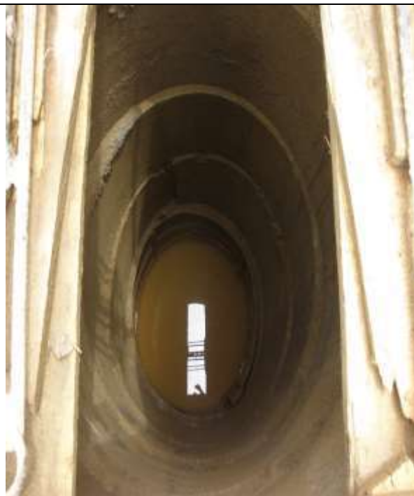
Foto No. 8. Caisson sin su debido plafón de protección. Altura 8.0 mts.

En relación con la verificación de pago de salarios y seguridad social, en visita realizada el 22 de marzo de 2019, se presentó un hecho, donde trabajadores del contratista se manifestaban de manera informal, poniendo en conocimiento la falta de pago por parte del contratista en sus honorarios desde el 15 de febrero de 2019. Adicional a esto, según ellos, se les ha negado el ingreso al campamento para retirar sus pertenencias que aún se encuentran allí. Al respecto, la interventoría manifestó que, desde enero de 2019, el contratista no se encuentra al día con las afiliaciones del personal de obra que actualmente labora. Para el día de la visita, se encontró un total de 20 personas en actividades de ejecución del proyecto, ubicadas principalmente en las obras del eje vial No. 1.