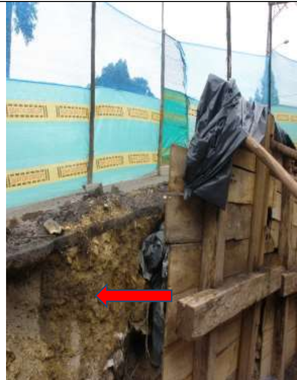
Foto No. 10. Socavación mínima.