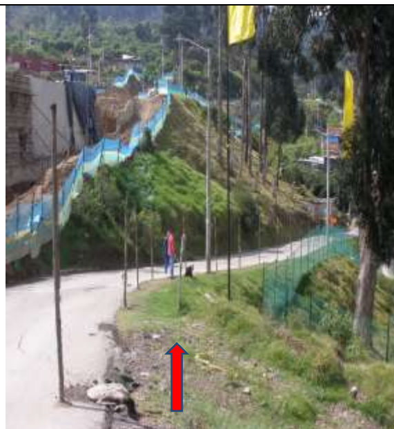
Foto No. 2. Sendero peatonal aún no señalizado en el Eje vial No. 3.