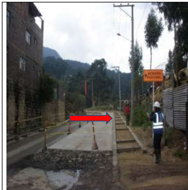
Foto No. 1. Costado derecho del eje No. 1 y ubicación del sendero peatonal en el lado contrario al indicado en el PMT.

Por otro lado, se verificó la instalación de las señales establecidas en el PMT como lo son las instalaciones de las vallas, colombinas, señales Reglamentaria de Obra - SRO-30, Señales Preventivas de Obra - SPO-01, barricadas y Señales Informativas de Obra SIO-05, evidenciándose, en términos generales, adecuada ubicación e instalación de las mismas. No obstante, se reitera la observación sobre la inadecuada ubicación de la señal sobre el sendero peatonal del eje 1 (Ver Foto No. 1).