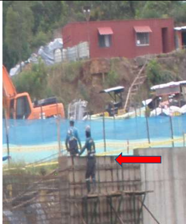
Foto No. 5. Trabajo en altura con arnés sin asegurar.