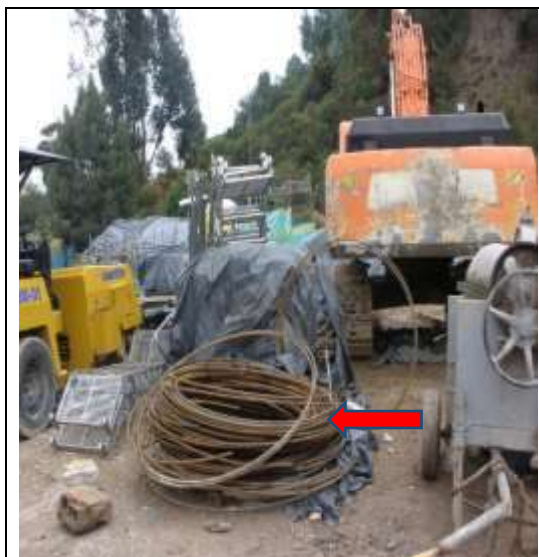
Foto No. 11. Material expuesto a la intemperie.