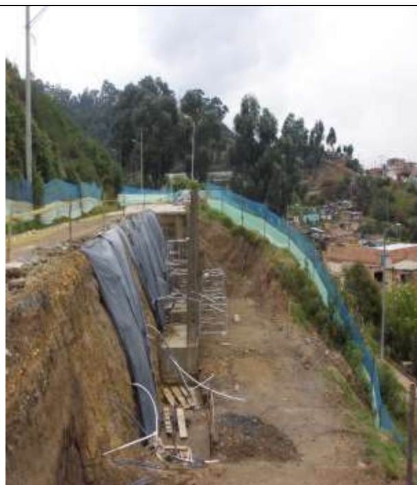
Foto No. 17. Muro 3 sin actividad de intervención.