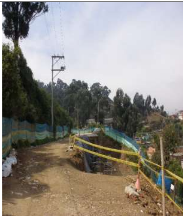
Foto No. 7. No se observa aviso de excavación profunda.