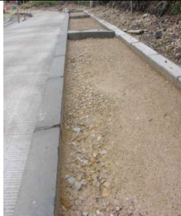
Foto No. 14. Segregación de material.