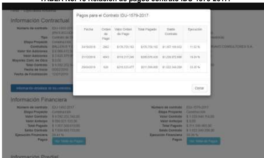
TABLA No. 15 Relación de pagos contrato IDU-1579-2017.

Fuente: Sistema de información ZIPA – 04-04-2019.