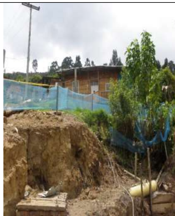
Foto No. 18. Muro en gavión sin actividad de intervención.