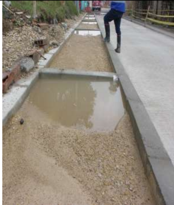
Foto No. 13. Saturación de material.