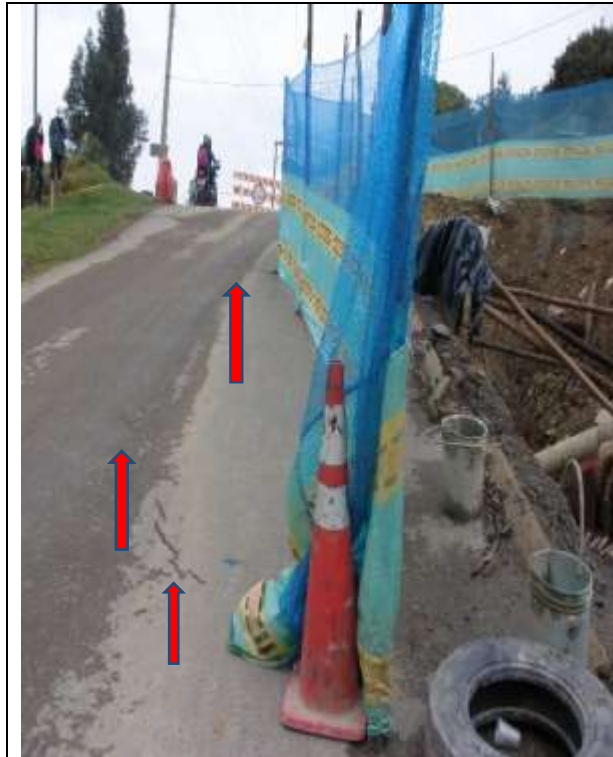
Foto No. 9. Fisuramiento longitudinal.

fotográfico No. 9 y 10, generando posibles riesgos de deslizamientos en la media calzada que se encuentra habilitada.