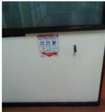
Calle 20 piso 6.