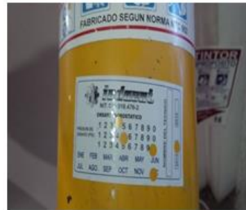
Alcázares piso 2