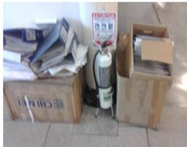
Alcázares piso 2