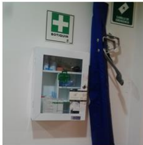
Camilla Lona piso 6 sede calle 20. Botiquín incompleto.

Se observan camilla rígida en madera, la cual no se está cumpliendo con lo establecido en la Resolución N°9279 de 1993, parte 62, VIII Camilla. Así mismo, se evidenció que los botiquines no contienen los insumos requerido y exigidos dentro del Plan de emergencias y contingencias para las diferentes sedes del IDU