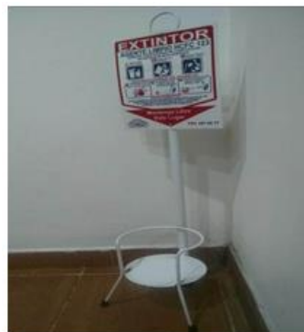
Sede calle 20 piso 4