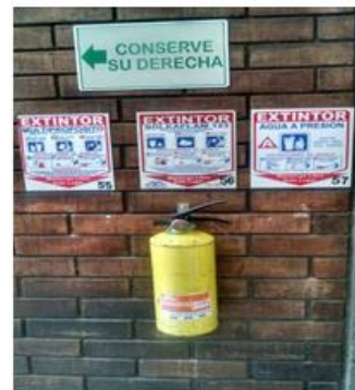
Sede calle 20 piso 4

Este documento está suscrito con firma mecánica autorizada mediante Resolución No. 106583 de diciembre 10 de 2014