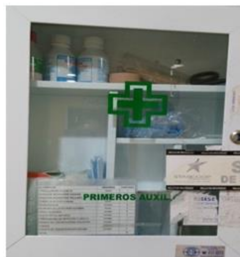
Botiquines Calle 20

Se presenta registro fotográfico de la inspección realizada al Piso 2° de la sede Alcázares el día 10 de noviembre de 2015 (ver registro fotográfico)