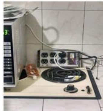
Sede calle 20 Cafetería 4° Piso