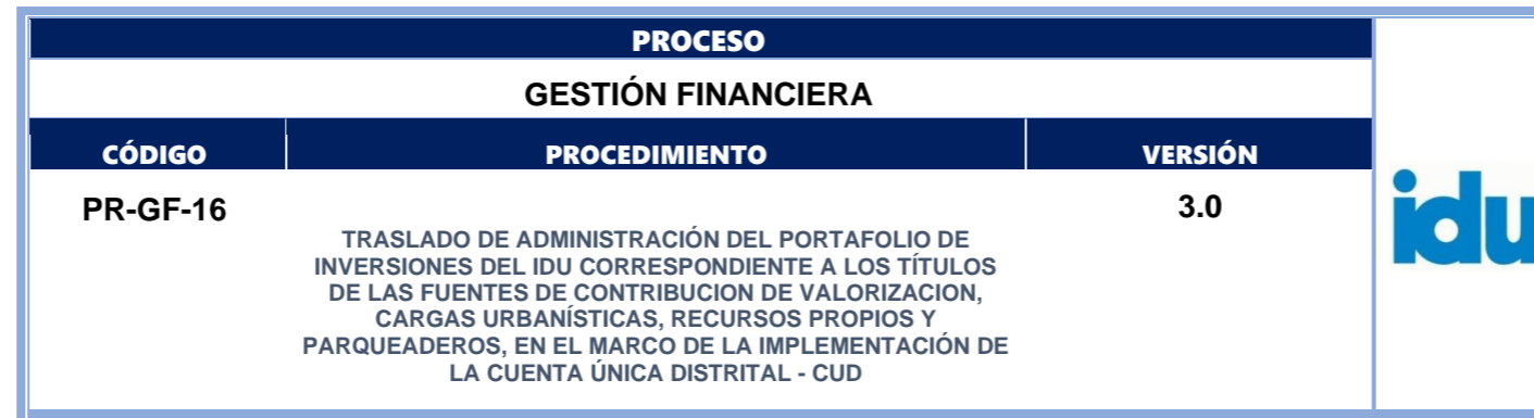
DIAGRAMA DEL PROCEDIMIENTO TRASLADO DE ADMINISTRACION DEL PORTAFOLIO DE INVERSIONES - CUD