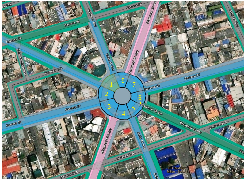
Ilustración 1: Glorieta Barrio Inglés, localidad de Rafael Uribe Uribe.

Público – SITP, conformado por los siguientes segmentos viales (PK_ID), que se describen a continuación: