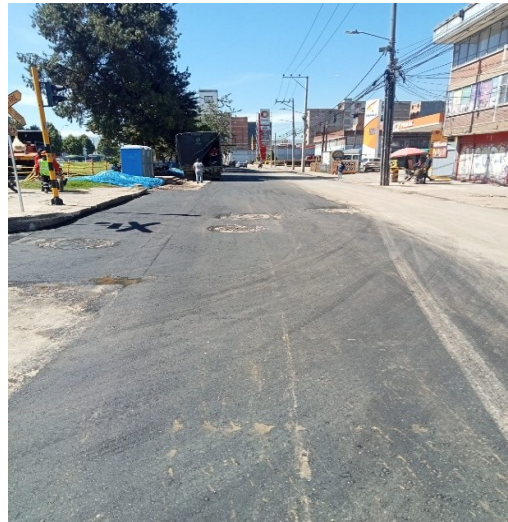
Avenida Ferrocarril (Calle 22) entre Carrera 100 y Carrera 99