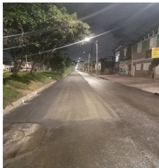
Avenida Ferrocarril (Calle 22) entre Carrera 110 y Carrera 108

Conforme a lo anterior, se emite respuesta dentro de los términos previstos en la Ley 1755 de 2015, esperando haber atendido de forma satisfactoria la solicitud presentada, agradeciendo su interés y reiterando una vez más la voluntad de servicio