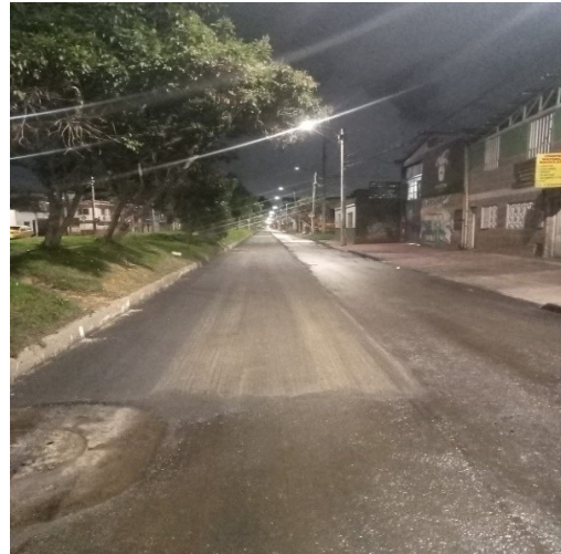
Avenida Ferrocarril (Calle 22) entre Carrera 110 y Carrera 108

Conforme a lo anterior, se emite respuesta dentro de los términos previstos en la Ley 1755 de 2015, esperando haber atendido de forma satisfactoria la solicitud presentada, agradeciendo su interés y reiterando una vez más la voluntad de servicio