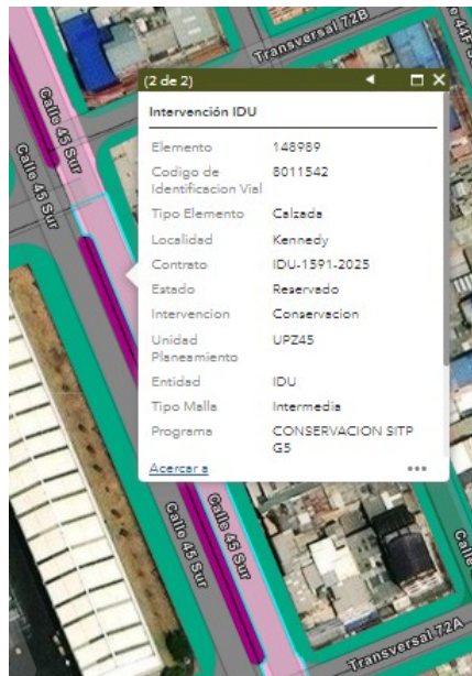
Sistema de Información Geográfico del IDU – SIGIDU

Al respecto, es importante aclarar que si bien este segmento vial se encuentra priorizado para su intervención dentro del Contrato de Obra IDU-1591-2025, a la fecha dicho contrato se encuentra exclusivamente en etapa de diagnóstico . En esta fase preliminar se adelantan los estudios y tramites técnicos necesarios para definir el alcance específico de las obras, lo que significa que el IDU aún no ha iniciado actividades de intervención física en la vía.