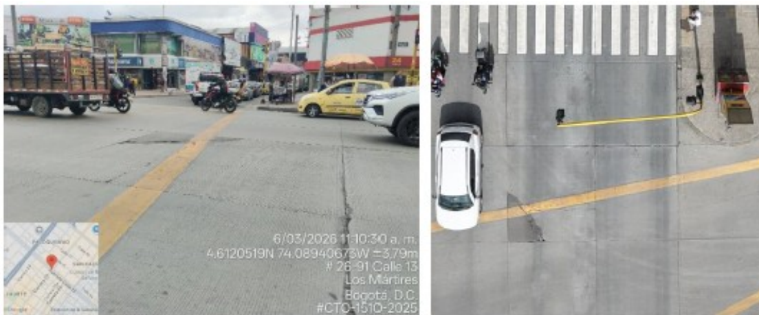
Imagen 5 Registro fotográfico calzada BRT Sentido Occidente-Oriente con intersección de Carrera 27

Con las acciones descritas, el Instituto de Desarrollo Urbano ratifica que está adelantando las labores técnicas, administrativas y contractuales necesarias para ofrecer una solución integral y definitiva a las condiciones de deterioro vial reportadas.