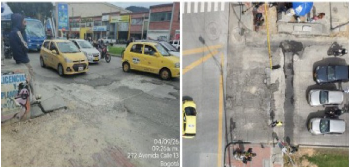
Imagen 2: Identificación de afectaciones en la visita de Contratista IDU-1510-2025 e interventoría

Te invitamos a hacer uso del formulario de Radicación Web