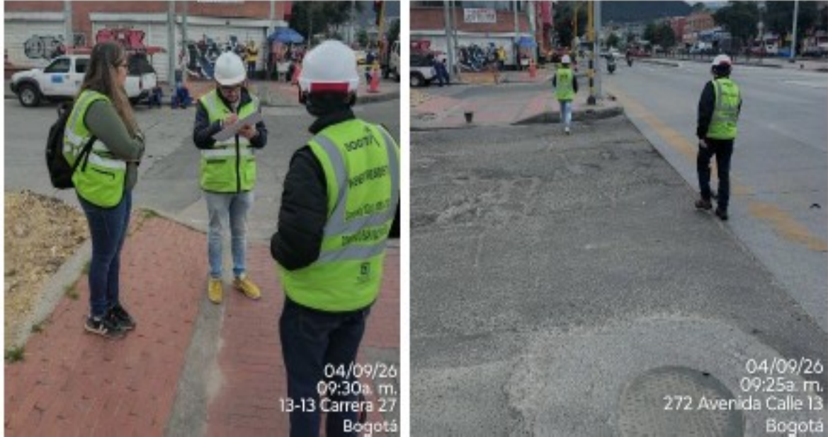
Imagen 1: Registro fotográfico visita técnica 09 de abril de 2026.

DTCI 202638500859901 Información Pública Al responder cite este número