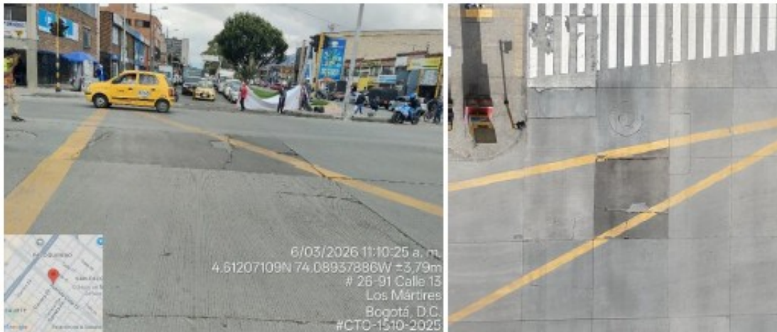
Imagen 4 Registro fotográfico calzada BRT Sentido Oriente-Occidente con intersección de Carrera 27.

generarán una afectación directa sobre la operación del vagón F de la estación Ricaurte.