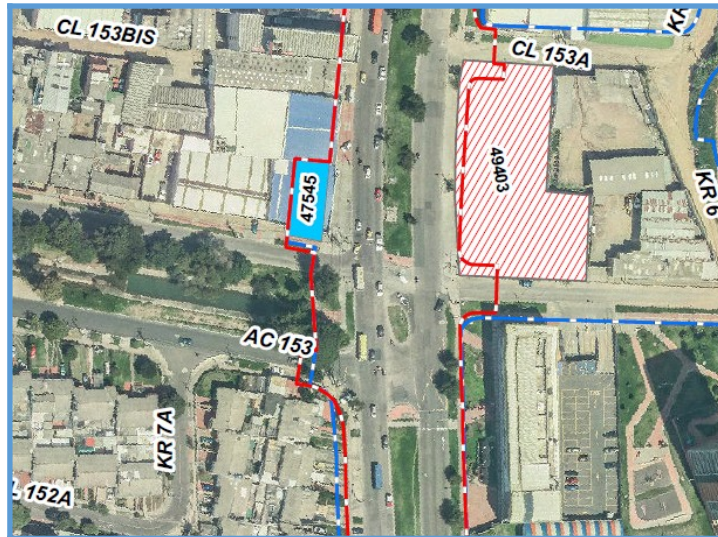
Esquema intervención Calle 153 con Cr 7

STEST 202634600815321 Información Pública Al responder cite este número