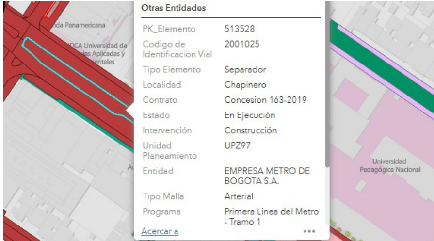
Imagen, fuente: SIGIDU – IDU.

DTCI 202638500817211 Información Pública Al responder cite este número