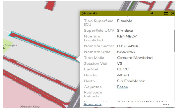
Tipo malla Vial - SIGIDU

la cual se remite copia de la presente respuesta para su pronunciamiento respectivo.