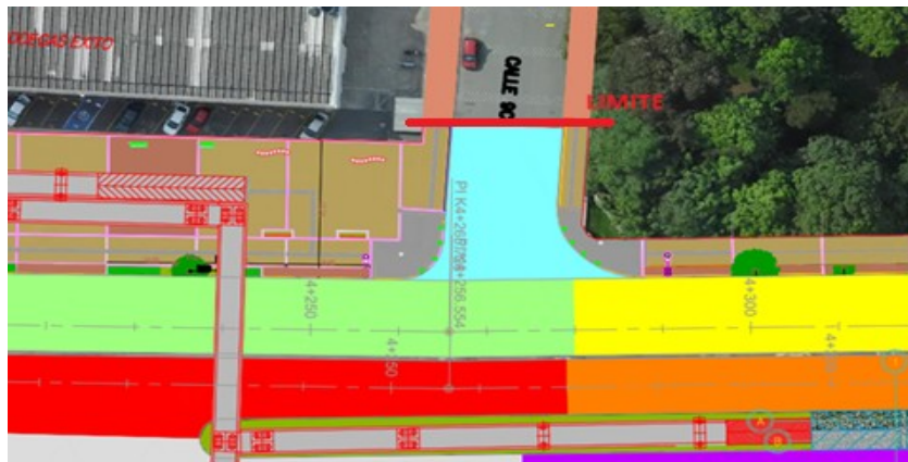
Imagen Urbanismo Calle 9C

Ahora bien, consultado el sistema de información SIGIDU, se evidencia que la vía identificada con el CIV 8004339 corresponde a la malla vial Circuito de Movilidad, la cual por competencia corresponde su atención a la Alcaldía local de Kennedy, a