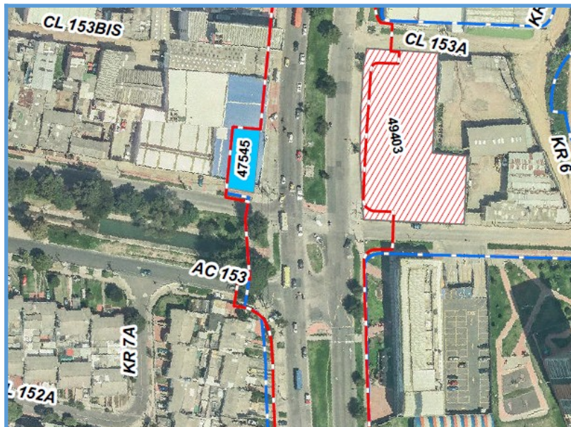
Esquema intervención Calle 153 con Cr 7

No obstante, revisado el alcance de las obras a ejecutarse con el Contrato de obra IDU-1727-2023 se encontró que, en la Calle 153 se intervendrá la bocacalle tanto en vía como en andén, pero únicamente hasta el límite del proyecto, el cual se puede identificar con la línea roja en la siguiente imagen: