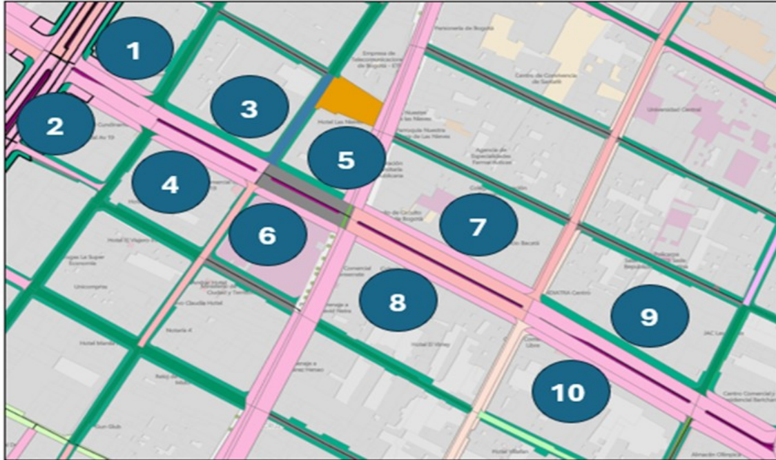
Ilustración. Consulta SIGIDU

STCSV 202638600805091 Información Pública Al responder cite este número