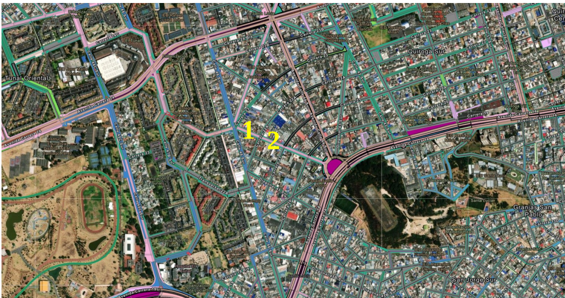
Ilustración 1: barrio Santa Lucía, localidad de Rafael Uribe Uribe.

De conformidad con la verificación realizada en el Sistema de Información Geográfica del IDU - SIGIDU , se identificó que el tramo objeto de la solicitud está conformado por el siguiente segmento vial (PK_ID), que se describen a continuación: