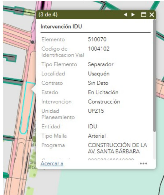
Carrera 19 con Calle 134

Esperamos con la anterior información haber atendido su solicitud y quedamos atentos ante cualquier requerimiento o aclaración adicional al respecto.