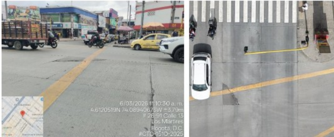
Imagen 5 Registro fotográfico calzada BRT Sentido Occidente-Oriente con intersección de Carrera 27

DTCI 202638500772781 Información Pública Al responder cite este número