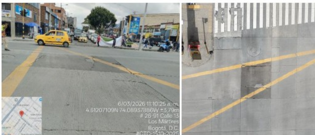
Imagen 4 Registro fotográfico calzada BRT Sentido Oriente-Occidente con intersección de Carrera 27.

Actualmente, estas actividades se encuentran en la fase de estructuración del Plan de Manejo de Tránsito (PMT) de emergencia . Este plan está siendo coordinado de manera estrecha con TransMilenio, debido a que las obras generarán una afectación directa sobre la operación del vagón F de la estación Ricaurte.