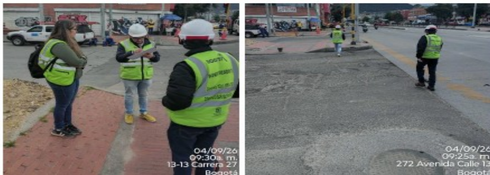
Imagen 1: Registro fotográfico visita técnica 09 de abril de 2026.

Te invitamos a hacer uso del formulario de Radicación Web