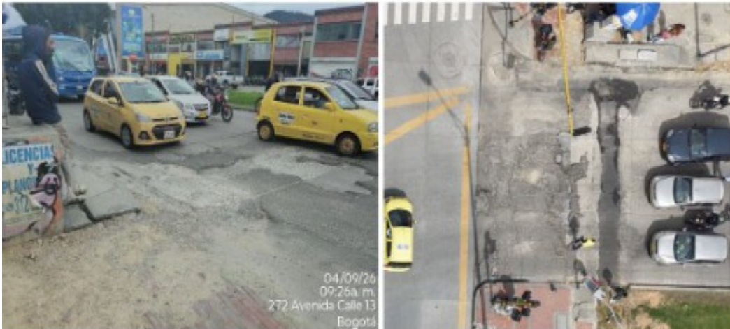
Imagen 2: Identificación de afectaciones en la visita de Contratista IDU-1510-2025 e interventoría

DTCI 202638500772781 Información Pública Al responder cite este número