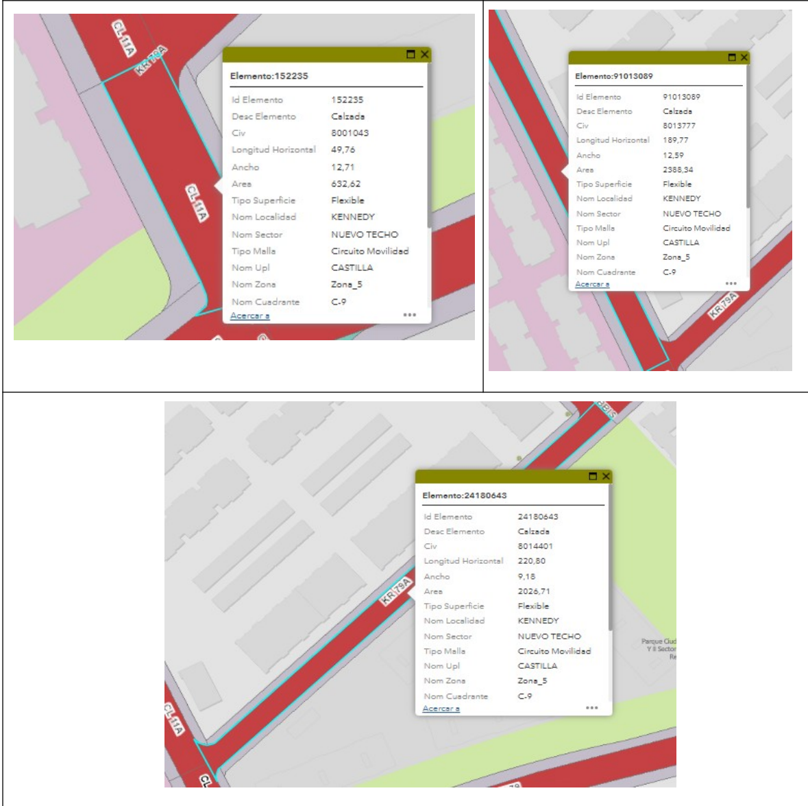
Fuente UMV (Unidad administrativa especial de Rehabilitación y Mantenimiento Vial)

Te invitamos a hacer uso del formulario de Radicación Web https://www.idu.gov.co/page/radicacion-correspondencia