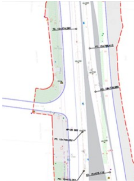
Esquema intervención Calle 168 con carrera 7

En consecuencia, se informa que la reserva que tiene el Contrato IDU-1727-2023 sobre el CIV1001491 solo obra hasta el límite de intervención del proyecto (línea roja), por tanto, se da traslado a la Alcaldía Local de Usaquén y a la Unidad de Mantenimiento Vial para que desde sus competencias informen al peticionario sobre las intervenciones de la Calle 168 entre Cr 7 y Cr 7F, en caso de que la Alcaldía o la UMV requieran realizar algún tipo de obra en la Calle 168 y que este por fuera del límite de intervención del proyecto podrá hacerlo y solo requerirá realizar la respectiva armonización con el contrato de obra IDU-1727-2023.