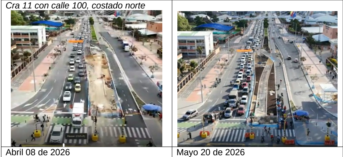
Abril 08 de 2026