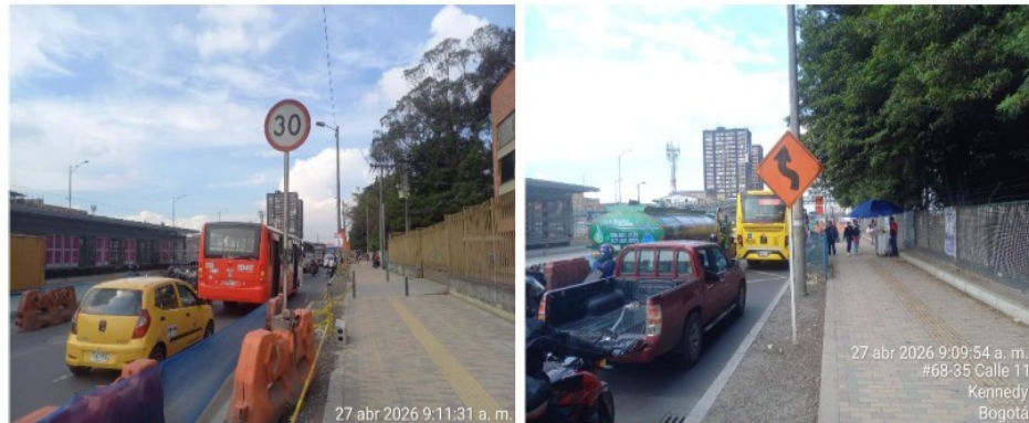
Imagen 3 y 4. Señalización previa al lugar del accidente de acuerdo con el PMT autorizado.

conducción segura de los diferentes actores viales. De igual manera, la superficie de rodadura se encontraba en condiciones adecuadas.