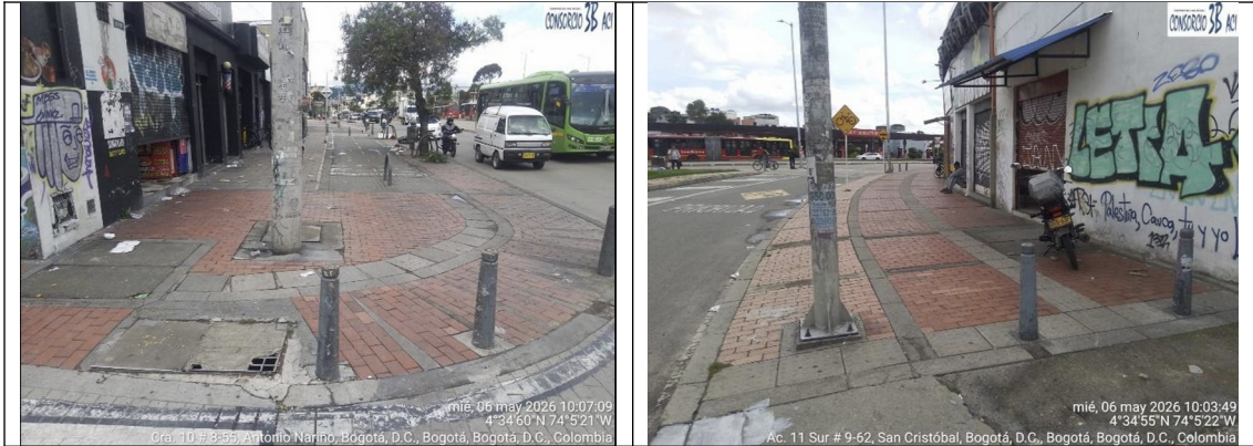
CIV 4000120 – PKID 92082912 (Andén) Calle 11 Sur entre la Carrera 9 y la Calle 10 Sur Fuente: Consorcio 3B ACI – 06/05/2026

DTCI 202638500637121 Información Pública Al responder cite este número