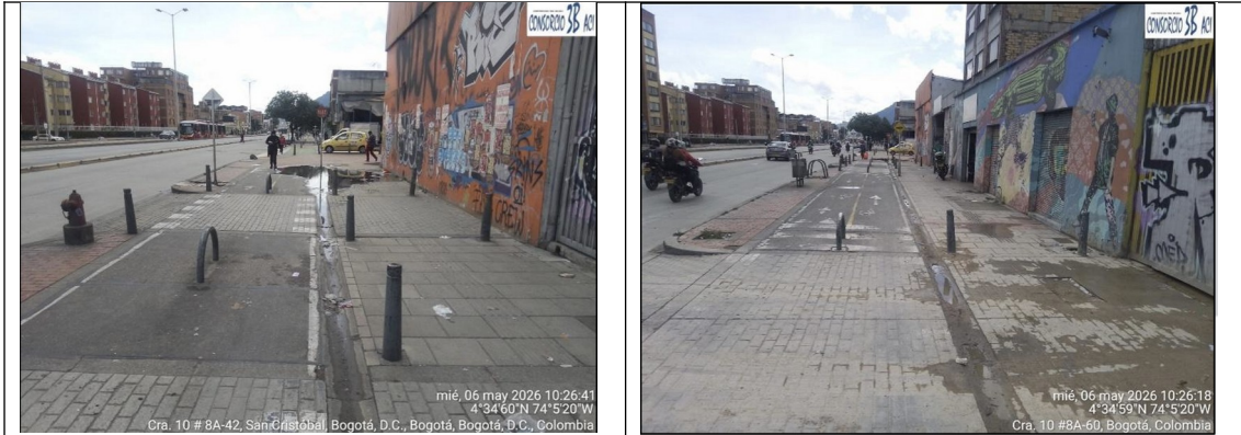
CIV 4000107 – PKID 200293 (Andén) Carrera 10 entre Calle 10 Sur y Calle 8A Sur Fuente: Consorcio 3B ACI – 06/05/2026

DTCI 202638500637121 Información Pública Al responder cite este número