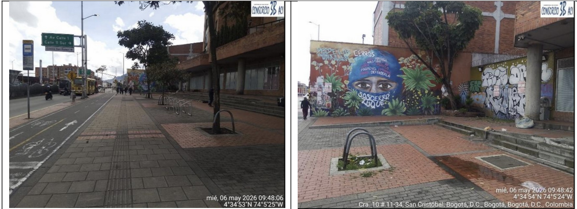
CIV 4007627 – PKID 200442 (Andén) Carrera 10 entre Calle 11 Sur y Calle 13 Sur Fuente: Consorcio 3B ACI – 06/05/2026

DTCI 202638500637121 Información Pública Al responder cite este número