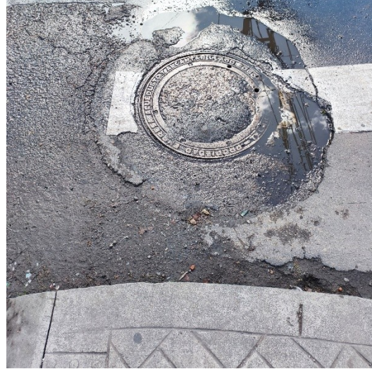
Figuras, fotos: Daño (hueco) y Pozo Red Alcantarillado, Calle 3 B con 41 A.

De acuerdo con lo anterior, y conforme lo señalado en el artículo 1 de la Ley 1755 de 2015 1 , que modificó el artículo 21 de la Ley 1437 de 2011 2 , estando dentro del término legal, mediante el presente oficio damos traslado de su requerimiento a la EAAB E.S.P., por ser la entidad responsable de la red de alcantarillado de la ciudad, con el fin, que en el marco de sus competencias realicen las gestiones y acciones que consideren pertinentes para dar respuesta de fondo, y donde se podrá realizar el seguimiento respectivo.