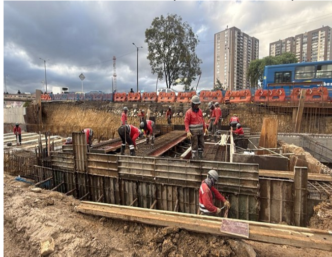
Personal nivel superior del deprimido

Ahora bien, a nivel superior del Deprimido también se encuentra otros frentes de obra con personal adelantando el armado de aceros y la fundición de Vigas superiores, con el cual permite ir finalizando las actividades pendientes del deprimido