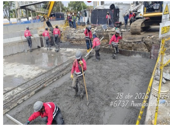
Pavimentación Losa Aproximación

Cabe resaltar que la mayoría de personal se encuentra al interior del deprimido continuando con la construcción de vigas inferiores, armado de aceros, y la construcción de la losa de fondo, la cual no se ven o identifican a simple vista al circular por la Avenida 68.