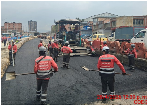
Personal pavimentación carriles mixtos

Frente a su queja de ver poco o escaso personal de obra, nos permitimos informar que el contrato de Obra afectivamente cuenta con el personal de obra necesario para continuar desarrollando las diferentes actividades de Obra, como se evidencia en el siguiente registro fotográfico.