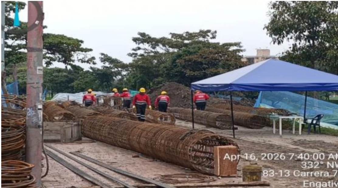
Fotografía N°3: Amarre y figurado de acero para canastilas de pilotes del costado occidental.