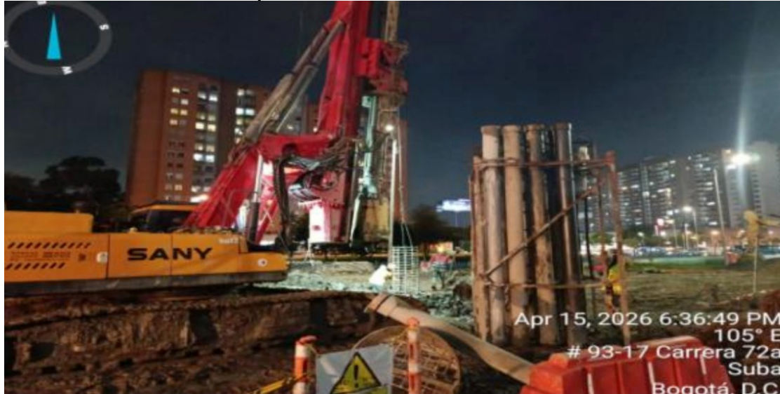
Fotografía N°2: Izaje de canastila de acero para posterior vaciado de concreto para pilotes del costado occidental.