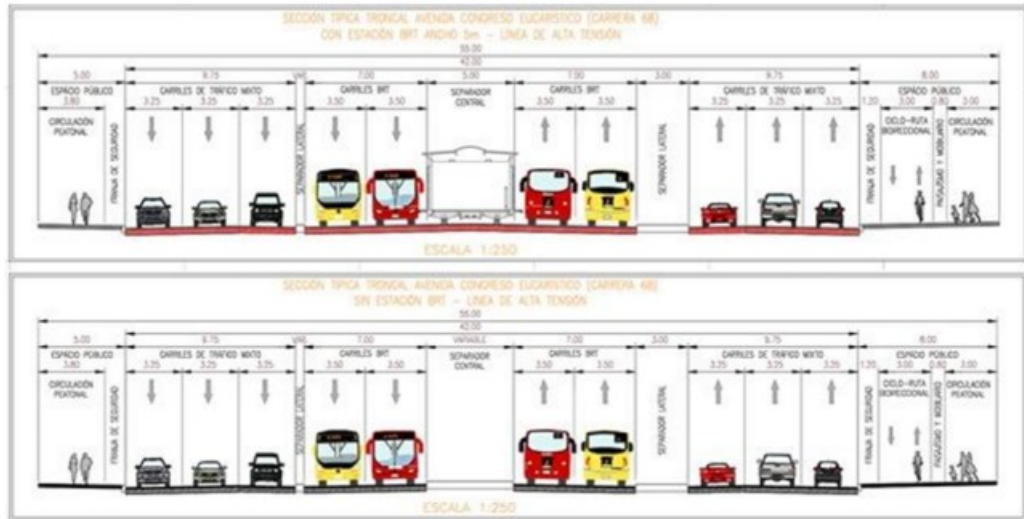
Sección transversal típica.

STEST 202634600500261 Información Pública Al responder cite este número