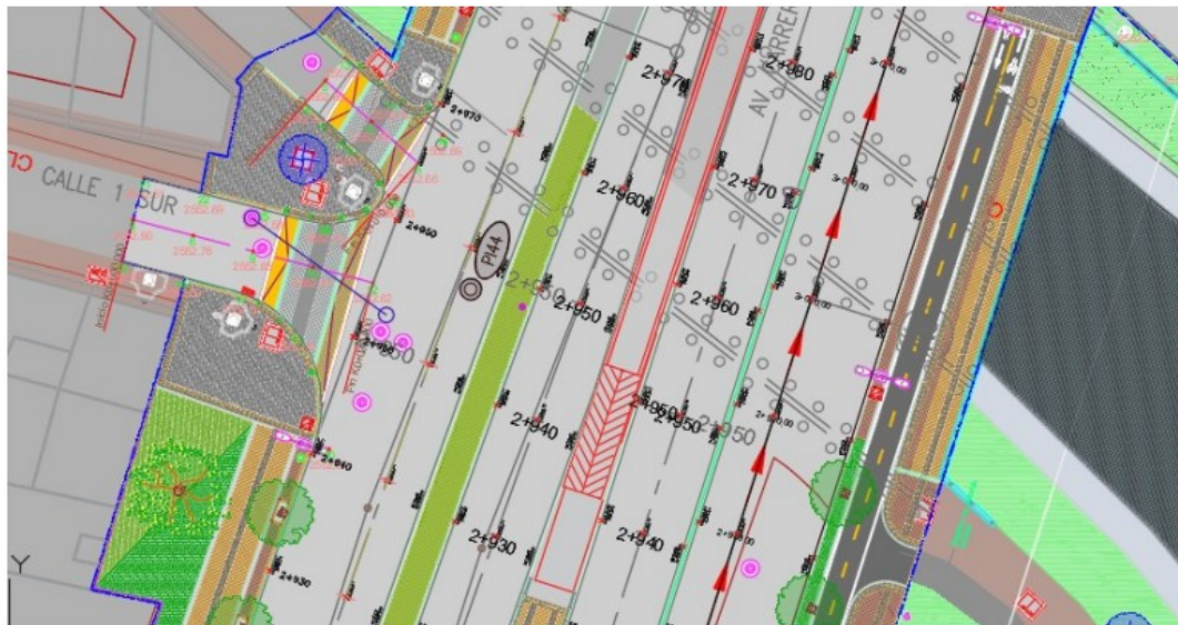
Planta de espacio y calzada mixta y BRT – Calle 1.

La Interventoría, en cumplimiento de sus obligaciones contractuales, y de acuerdo con lo manifestado por el Contratista, confirma que la información presentada por el Contratista corresponde a lo aprobado y que se está construyendo por parte de este. Se aporta planta en la zona donde se localiza el predio con nomenclatura carrera 68 Bis 1 – 14 sur, así como sección transversal típica. Así las cosas: