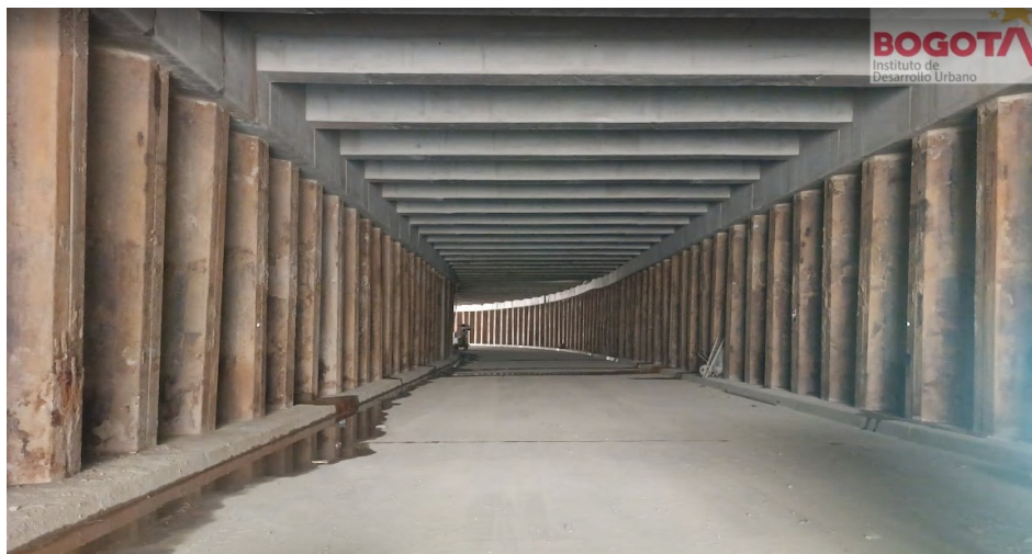
Foto. Interior del Deprimido

Particularmente, la construcción del deprimido de la Avenida Las Américas con Carrera 68 registra un avance ejecutado del 85,60%, de los cuales de los 486 metros de longitud, restan tan solo 50 metros para conectar el frente de la Av. Américas con el frente de la Av. 68