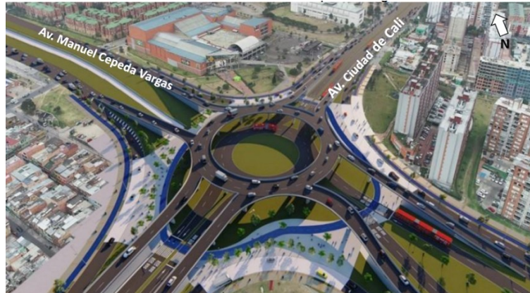
Ilustración 1. Render Glorieta Elevada

El contrato cuenta con un valor actual de $185.798.854.036,00 y un plazo total de 119 meses, distribuidos en 20 meses de etapa de Preconstrucción, 39 meses de etapa de construcción y 60 meses de etapa de mantenimiento.