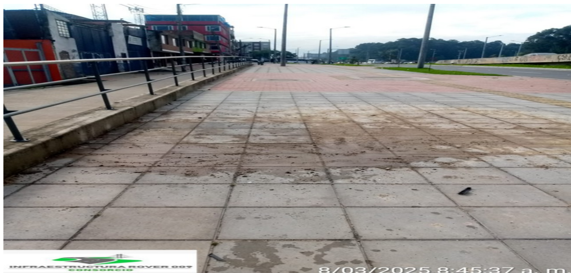
Registro fotografía Costado Oriental de la Av. Boyacá por Av. Guayacanes

correcciones y/o remates solicitados por las ESP para recibo a satisfacción de la infraestructura.