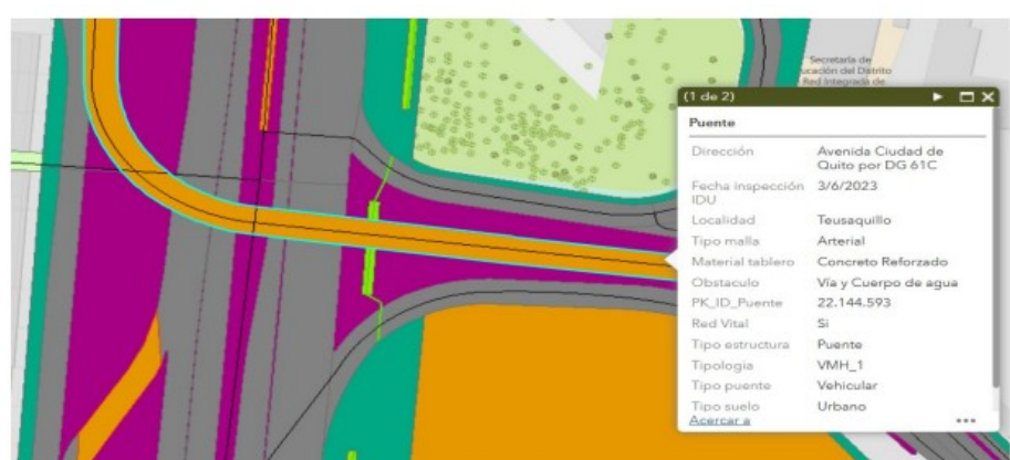
PK_ID_ PUENTE 22144593 (Zona Bajopuente Costado Oriental)

“Por la cual el Instituto de Desarrollo Urbano - IDU realiza entrega temporal de la administración y mantenimiento preventivo y rutinario de elementos del espacio público al Departamento Administrativo de la Defensoría del Espacio Público DADEP, conforme al numeral 13.1 del artículo 13 del Decreto Distrital 315 de 2024”