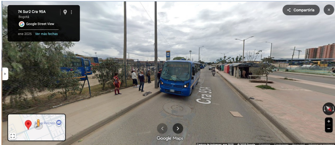
Imagen No. 1: Captura de pantalla de la consulta realizada en el aplicativo Streetview.

DTCI 202538501262061 Información Pública Al responder cite este número