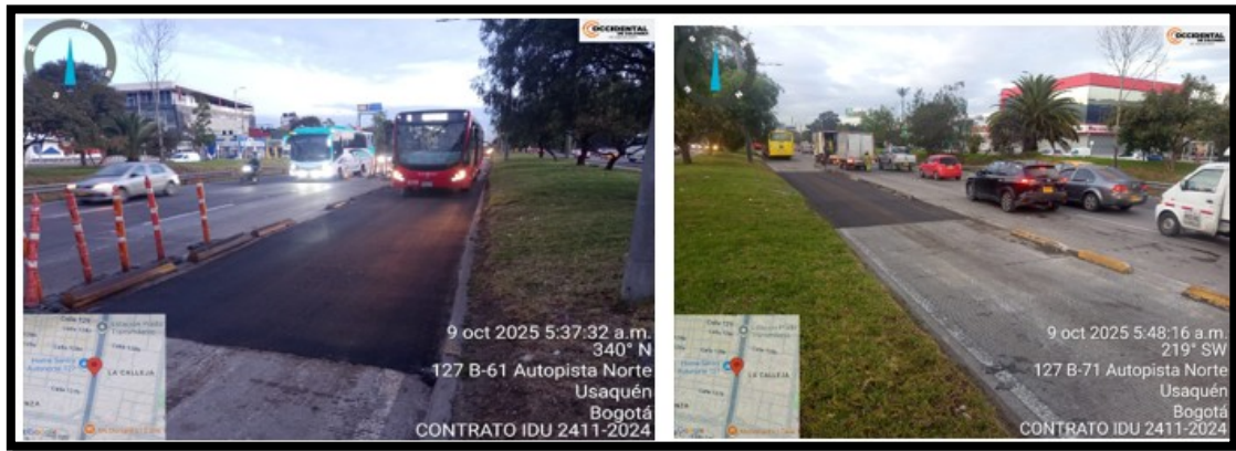
Ilustración 2. Registro fotográfico, después de la intervención