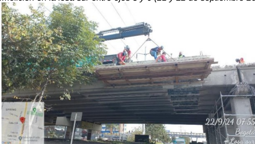
Demolición de losa en el voladizo sur entre ejes 5 y 6.

Te invitamos a hacer uso del formulario de Radicación Web