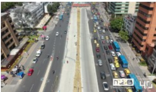
Carriles BRT Calle 100 con Kr 19