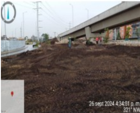
Calle 3 Plantación individuos arbóreos

STEST 202434601310781 Información Pública Al responder cite este número