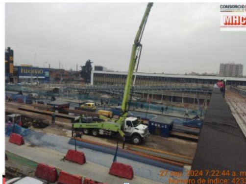
Puente Peatonal Calle 11