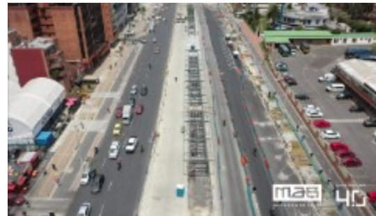
Espacio Público Calle 100 con Kr 11

De conformidad con lo expuesto se precisa que las obras referidas en su petición no se encuentran abandonadas, sin perjuicio de lo anterior, la entidad y la interventoría ejercen control y vigilancia permanentemente con el fin de conminar al contratista al cumplimiento de sus obligaciones.