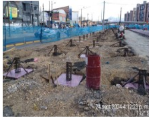
Estación Av. Américas Cimentación