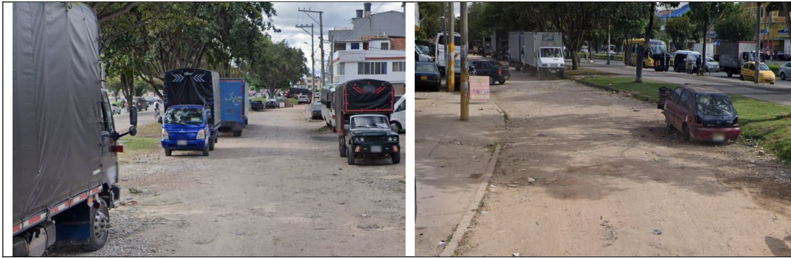
Fotografías carrera 104 con calle 131

DTCI 202438500558891 Información Pública Al responder cite este número