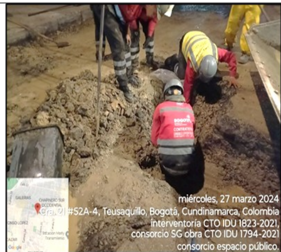
Imagen 2. Apique de verificación de presencia de agua