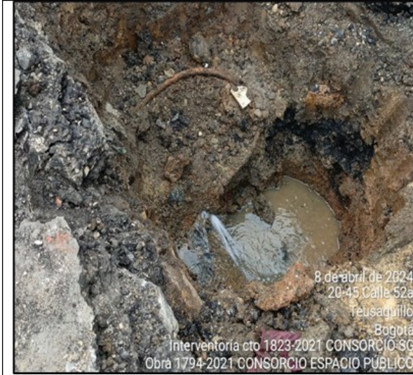
Imagen 3. Apique de ubicación de red de alcantarillado

STCSV 202438600553301 Información Pública Al responder cite este número