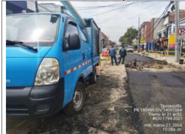
Imagen 7. Apoyo de personal de la EAAB ESP en el cambio de collarines

A la fecha las actividades avanzan y se cuenta con el apoyo de la EAAB para el cambio de los collarines y las conexiones de las acometidas-