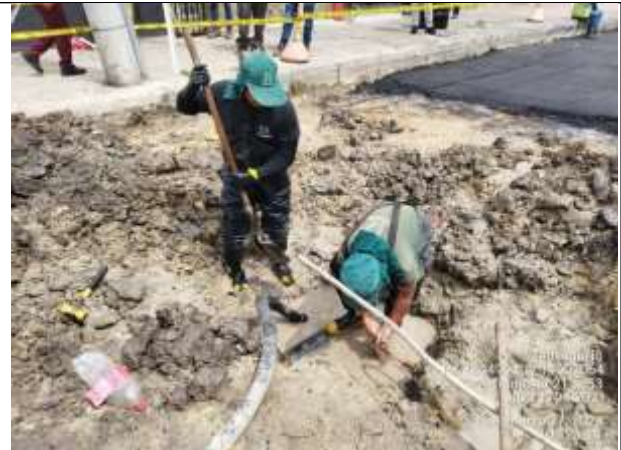
Imagen 8. Apoyo de personal de la EAAB ESP en el cambio de collarines

Por lo expuesto anteriormente, las obras han sido condicionadas a alargarse en tiempo de respecto de la programación inicial, en tal sentido el contratista estima la finalización de las actividades para el mes de mayo de 2024.