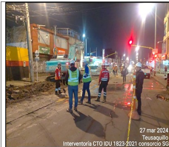
Imagen 1 Inicio de actividad de intervención sobre la calzada

De acuerdo a la programación presentada por el contratista, las actividades iniciaron en la jornada nocturna del día 26 de marzo de 2024 en el carril occidental de la carrera 21, en desarrollo del proceso constructivo, específicamente en la excavación se evidenció que las derivaciones de la tubería principal de acueducto de diámetro 8”, presentaban fugas de agua, por tanto, se realizó la inspección por medio de apiques y se evidenció que el material de dicha tubería es en hierro fundido -HF- y que la tubería hacia los predios es de cobre y sus empalmes son soldados, y en dichas uniones presentan las fugas, lo que ha generado la saturación de la estructura de la vía.