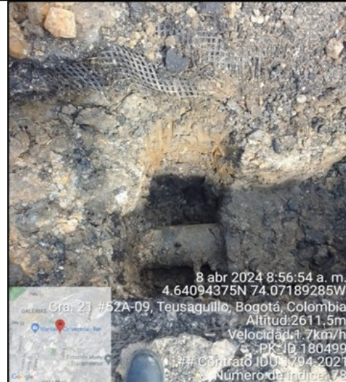
Imagen 4. Identificación de punto de derivación

Por lo anterior, se hizo necesario realizar coordinación con la Empresa de Acueducto y alcantarillado de Bogotá -EAAB ESP- para efectuar el cambio de los collarines de las acometidas domiciliarias que faltan y los que a la fecha se encuentran en mal estado.