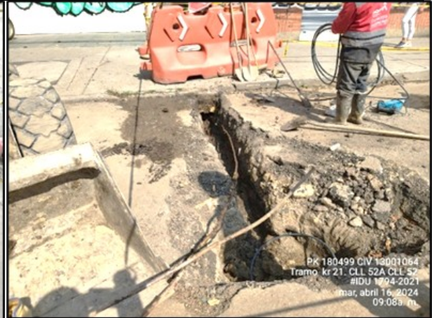
Imagen 6. Conexión de acometida domiciliaria desde ducto principal a medidor de predio.

A la fecha las actividades avanzan y se cuenta con el apoyo de la EAAB para el cambio de los collarines y las conexiones de las acometidas-