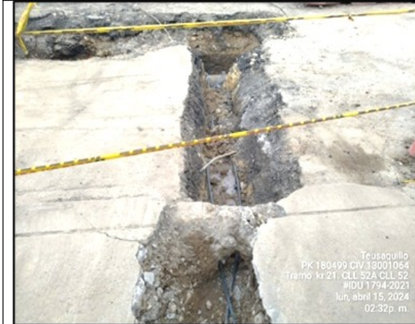
Imagen 5. Conexión de acometida domiciliaria desde ducto principal a medidor de predio

STCSV 202438600553301 Información Pública Al responder cite este número