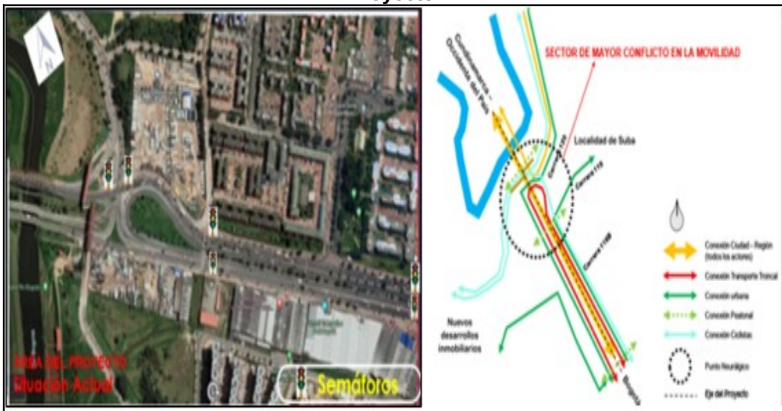
Figura 1. Localización Específica y Condiciones Actuales en el Área del Proyecto.

STED 20242360050621 Información Pública Al responder cite este número