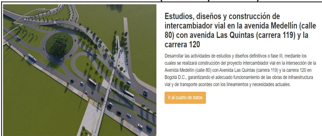
Figura 3. Cuarto de Datos Intercambiador Vial en la Intersección de la Avenida Medellín (Calle 80) con Avenida Las Quintas (Carrera 119) y la Carrera 120 – Resultados Factibilidad (Insumo Etapa Inversión).

Te invitamos a hacer uso del formulario de Radicación Web