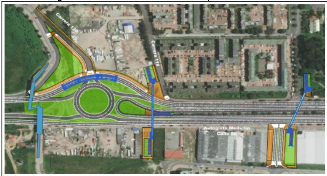
Figura 2. Alternativa seleccionada Etapa de Factibilidad

La alternativa seleccionada, que mejores beneficios ofrece a la movilidad del sector específico, en la Etapa de Factibilidad, a partir de la evaluación de la matriz multicriterio, se relaciona a continuación: