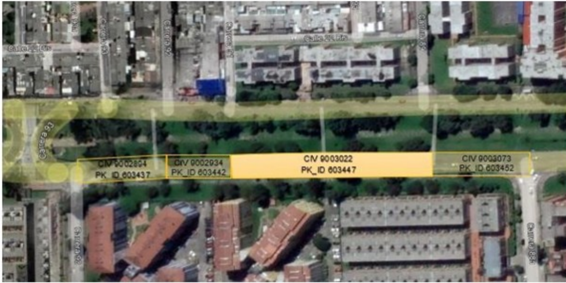
Imagen de Segmento Intervenido en Av. Calle 22 entre Carrera 88A y Carrera 93. En color amarillo, CIV 9003022 CON PK_ID 603447, intervención por Consorcio Gamma.

Las obras ejecutadas en el segmento de la Calle 22 entre Carrera 89 y 91 (calzada sur) corresponden a reacción por medio de técnicas de parcheo; las cuales se ejecutaron por fresado y reposición de la carpeta asfáltica en un espesor de 7.5 centímetros en mezcla asfáltica de tipo MD25. Estas actividades se ejecutaron en cumplimiento de la normatividad IDU y de los lineamientos establecidos en el Apéndice A del contrato de obra IDU 1712 de 2021.